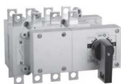
Modelo 0C Não inclui Terminais