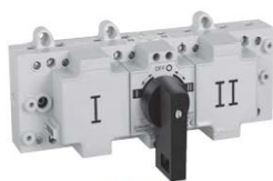
Modelo 1C Barra